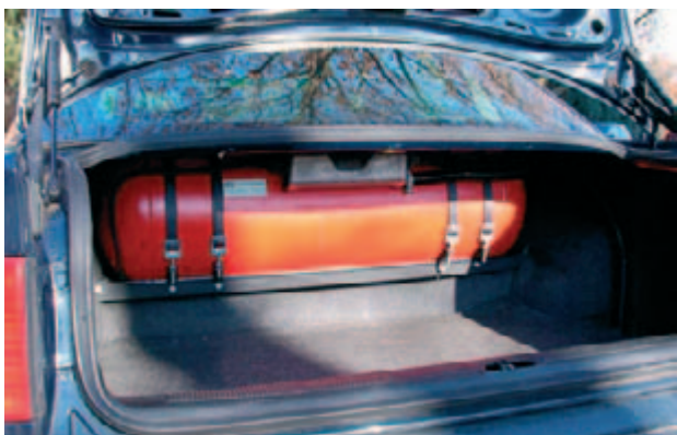
Gastank im Kofferraum