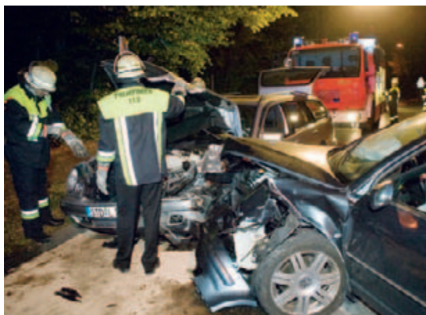
Bei einem Frontalzusammenstoß besteht bei Gasfahrzeugen kein erhöhtes Sicherheitsrisiko.

in denen Erdgas mit einem Druck von 200 bar gespeichert wird, sind aus Spezialstahl und für eine Druckbelastung von 600 bar (Berstdruck) ausgelegt. Jeder Behälter wird vor dem Einbau individuell geprüft. Zum zusätzlichen Schutz und im Falle einer Kollision sind die Tanks in einer stabilen Stahlrohrkonstruktion montiert.