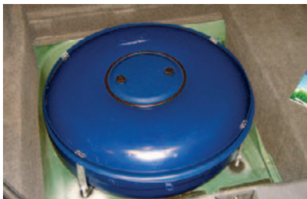
Gastank in Reserveradmulde